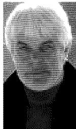
Valerio Massimo Manfredi Scrittore