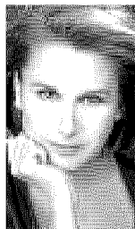
Paola Pitagora Affermata attrice di teatro